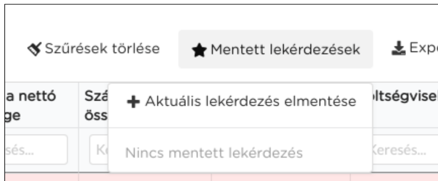
1. ábra - Lekérdezés mentése

Minden táblázatban lehetőség van a beállított szűrők és oszlopbeállítások elmentésére. Ehhez a szűrők és oszlopbeállítások megadása után a táblázat felett található Mentett lekérdezések gombra, majd az Aktuális lekérdezés elmentése lehetőségre kell kattintani. A felugró ablakban tetszőleges nevet adhatunk a beállított szűrőreseknek.