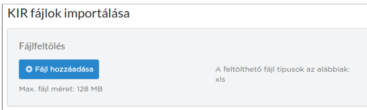
1. ábra - A fájlfeltöltés gombja

Az U-Office rendszerben lehetőség van a KIR-ben tárolt kifizetési adatok ellenőrzésére. Ehhez a KIR rendszerből kell havonta a témaszámainkhoz tartozó export fájl letölteni, majd ezeket a fájlokat feltölteni az U-Office rendszerbe. A fájlok feltöltéséhez a felületet a Lekérdezések menü KIR fájlok importálása menüpont alatt találhatjuk meg.